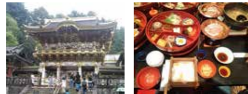
★日光東照宮や日光江戸村を観光