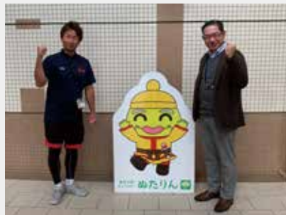
新潟市東総合スポーツセンター (ぬたりん)