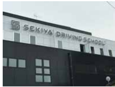
■関屋自動車学校（2019年）