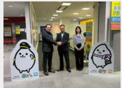
新潟空港ビルディング (米るくん、米ちゃん)