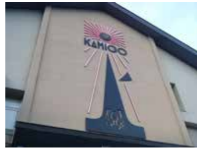
■大地の芸術祭 越後妻有「上郷クロープ座」（2015年）