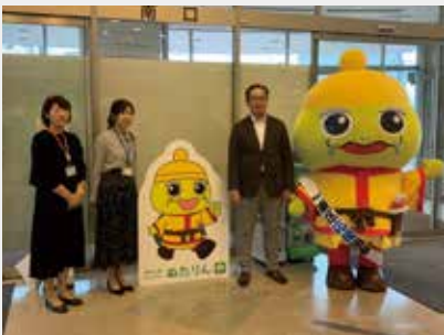
新潟市東区プラザ (ぬたりん)

弊社は本年、創業110周年を迎えました。このように永く事業を継続してこられたのは、ひとえに地域の皆様、企業様に深く愛されてきたからだと思えます。その長年のご愛顧に感謝の意を表すべく、弊社関連事業で地域に貢献できることはないかを模索していたところ、弊社社員のアイデアにより「フォトスポットパネルを製作、地域の公的施設や観光スポットに寄贈し、新潟を発信するお手伝いをしよう」ということで今回の事業を実施しました。