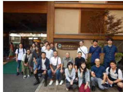
★社員旅行で日光鬼怒川へ（2019年）