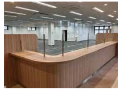
■飛散防止パーティション（2022年）