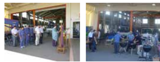
★新社屋開所式とお披露目BBQ