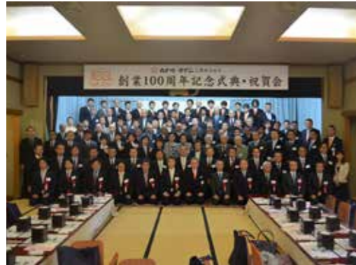
★行形亭にて創業100周年記念式典（2014年）