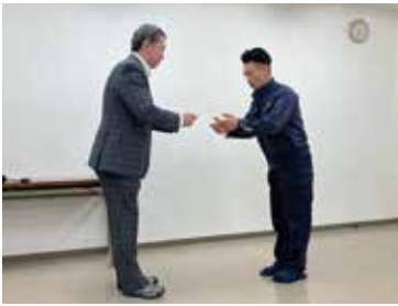
資格取得・セミナー受講表彰

弊社では毎年、資格取得やセミナー受講等の目標をたて、達成した社員を表彰しています。 資格によっては取得補助や資格手当がつかます。