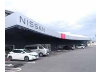
■日産スイングスクエア（2020年）