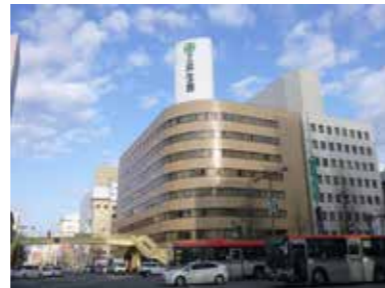
■三井生命新潟ビル（2016年）