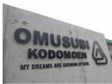
■おむすびこども園（2017年）