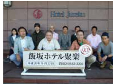
★創業100周年記念社員旅行で山形・福島へ（2014年）