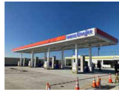
■セルフ新潟松崎（2023年）