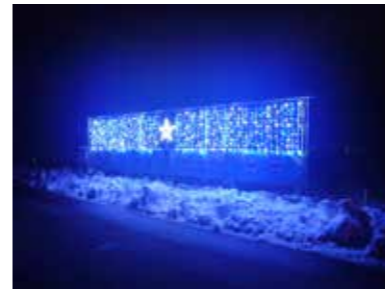
■イルミネーション（2022年）