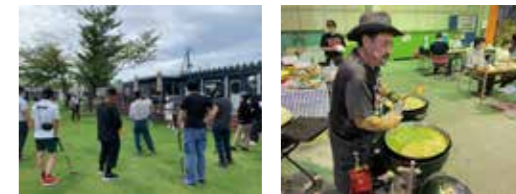
★創業110周年記念パークゴルフ大会&BBQ（2024年）