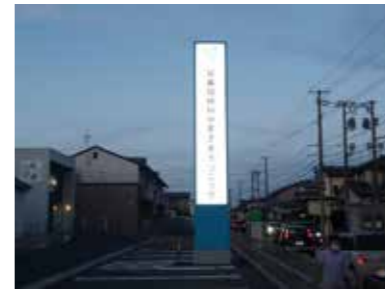
■耳鼻咽喉科やまざきクリニック（2023年）